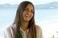
Brasiliana vende all'asta la sua verginità