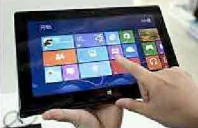
La rivoluzione 'mobile' Microsoft. Ecco Windows 8