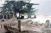
Uragano 'Sandy' a Cuba. Paura e morte nei Caraibi, piogge torrenziali e venti a 200 km l'ora