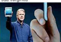
Ecco iPad mini, si può tenere in una mano